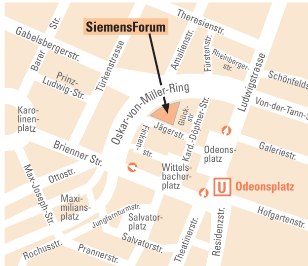
© Bayerisches Staatsministerium für Umwelt und Gesundheit

Veranstalter Bayerisches Staatsministerium für Umwelt und Gesundheit Veranstaltungszeit Montag, 14. Februar 2011 10:00–15:30 Uhr Anmeldung Bitte senden Sie die anhängende Fax-Antwort an: 089 9214–3733 Anmeldeschluss Montag, 7. Februar 2011 Teilnahmegebühr Die Teilnahme ist kostenfrei. Veranstaltungsort SiemensForum Oskar-von-Miller-Ring 20 80333 München Tel. 089 636–32660 Fax 089 636–32646 E-Mail: siemensforum.muc@siemens.com