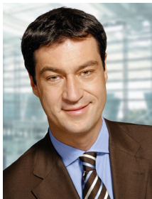
Dr. Markus Söder MdL Staatsminister

Die Tagung stellt die bayerische Telemedizinstrategie vor, zeigt neben diesem Blick in die nähere Zukunft aber auch, was heute bereits möglich ist und täglich den Patientinnen und Patienten zu Gute kommt.